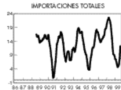
Se reanima la entrada de productos exteriores