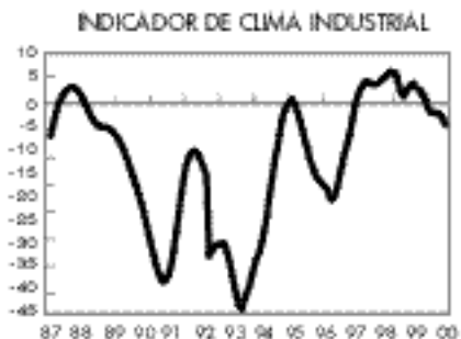
Se acentúa la pérdida de confianza en la evolución de la industria