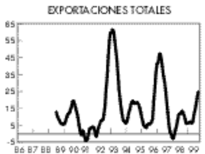
Fuerte dinamismo de las exportaciones