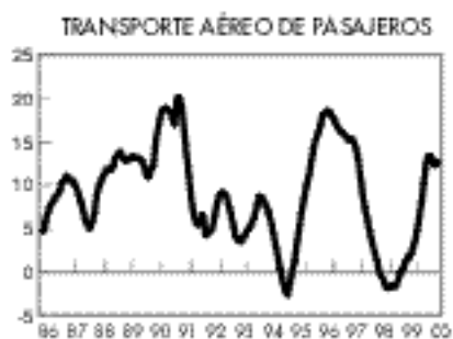
Permanece constante el ritmo de variación del turismo aéreo