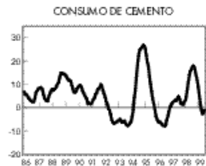
Cierta reactivación de la actividad constructora