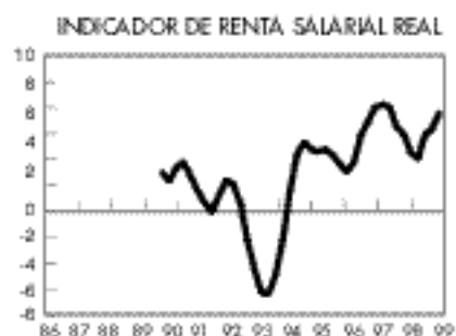
Las rentas laborales continúan en ascenso