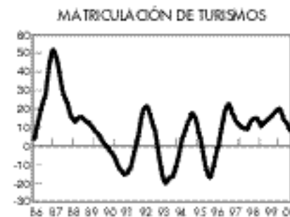
Deterioro en el ritmo de crecimiento del gasto en bienes duraderos