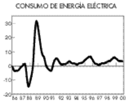
Se mantiene el ritmo de crecimiento del consumo eléctrico