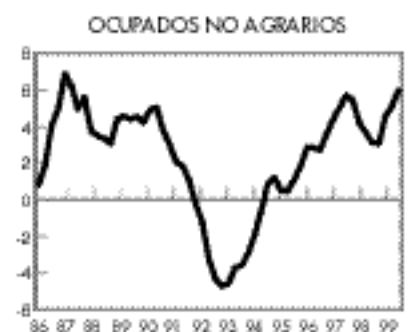
Excelente año 1999 en creación de empleo no agrario