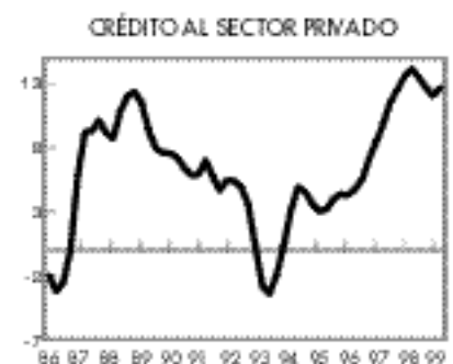
Se reactiva el ritmo de crecimiento de la concesión de créditos