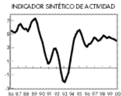
La actividad no agraria sigue creciendo más del 4%